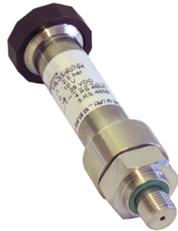
Drucksensor Serie 33

* Linearität + Hysterese + Reproduzierbarkeit + Nullpunkt