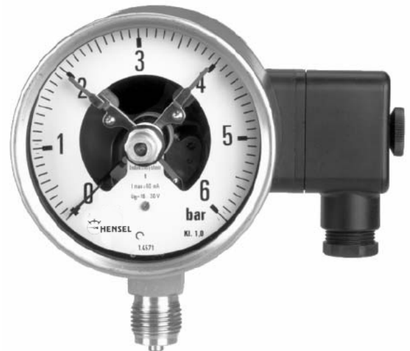
Kontaktmanometer mit seitlicher Kabeldose