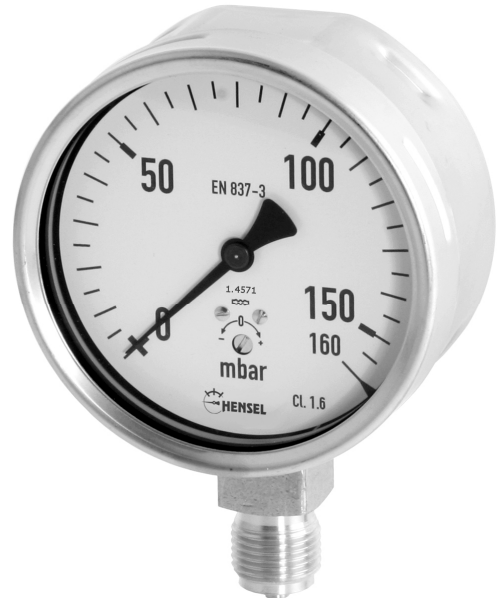
Kapselfedermanometer NG 63

Gehäuse NG 63: Edelstahl Ring: Edelstahl