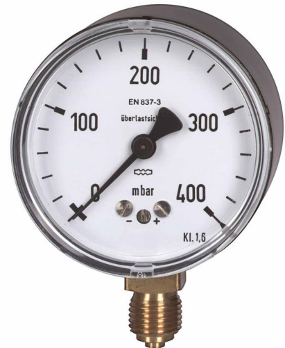
Kapselfedermanometer NG 63

NG 63: Stahl, schwarz Option: Kunststoff