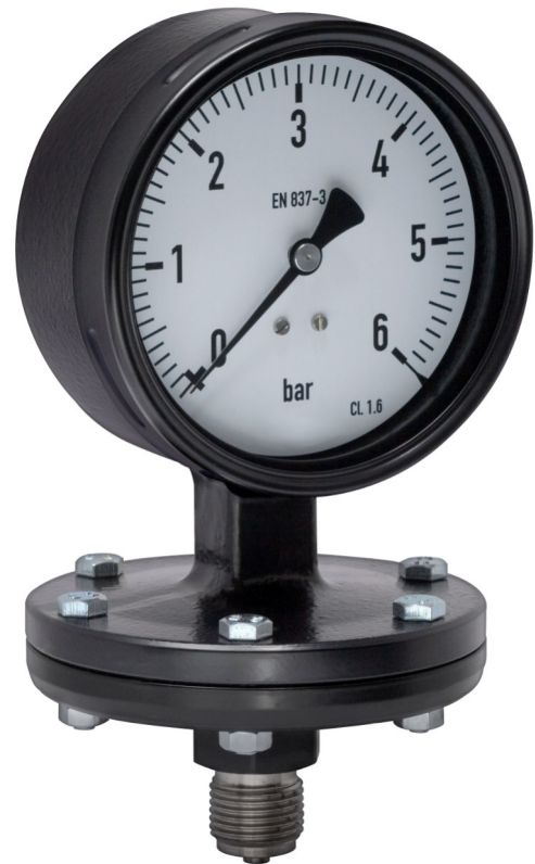
Plattenfedermanometer NG 100