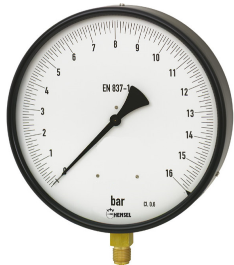
Feinmessausführung NG 160